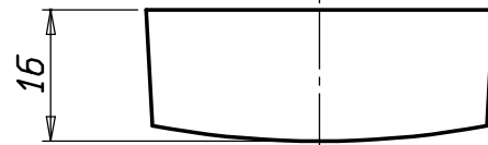
VISTA " A "